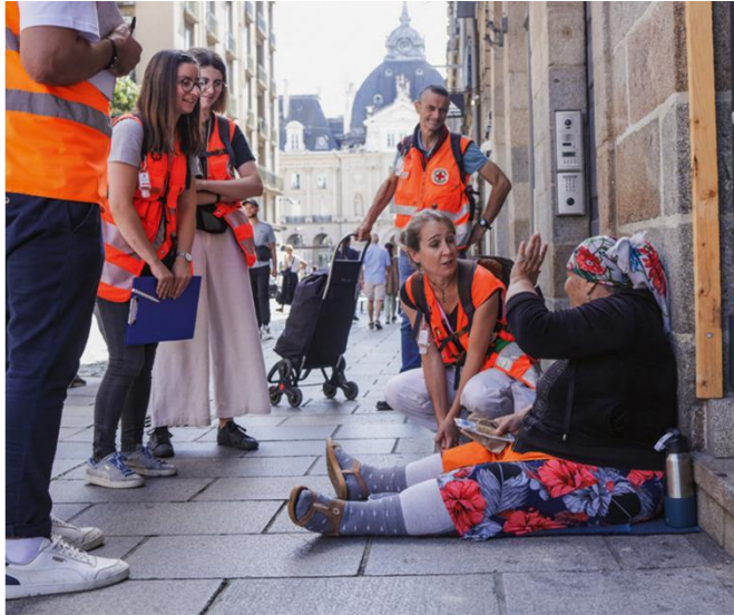
Doc. 3 Porter assistance aux plus démunis Maraude de la Croix-Rouge dans le centre de Rennes, septembre 2023.

Suite à la vague de froid qui s'abat sur la France, la préfète du Rhône a mis en place des mesures d'urgence pour les sans-abris dans le département, lundi 8 janvier au soir. Pour ce faire, il a été décidé de renforcer les maraudes, d'étendre les horaires d'accueil de jour et de sanctuariser une quinzaine de places d'hébergement. En plus, des places d'hôtels seront mobilisées provisoirement pour accueillir les ménages le plus fragiles. Ces mesures font suite à la décision de l'État de débloquer 120 millions d'euros pour 43 départements français placés en vigilance jaune de « grand froid », comme pour le Rhône et d'autres en vigilance d' « alerte grand froid » comme le Cantal et la Haute-Loire. La Tribune de Lyon, 10 janvier 2024