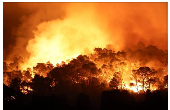
Doc. 5 L'incendie dans le département de l'Aude en août 2025

En Guyane, le niveau des fleuves, trop bas pour permettre la navigation, condamne près de 40 000 habitants à l'isolement et à des pénuries notamment d'eau potable sur le fleuve Maroni. Un pont aérien va ravitailler les territoires concernés.