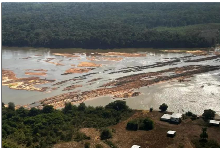
Doc. 4 Une sécheresse extrême en Guyane en 2024, année la plus chaude enregistrée depuis plus de 70ans.

En Guyane, le niveau des fleuves, trop bas pour permettre la navigation, condamne près de 40 000 habitants à l'isolement et à des pénuries notamment d'eau potable sur le fleuve Maroni. Un pont aérien va ravitailler les territoires concernés.