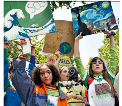
Doc. 3 S'engager pour le climat Des milliers de jeunes défilent pour exiger plus de mesures face au changement climatique, 24 mai 2019, Paris.