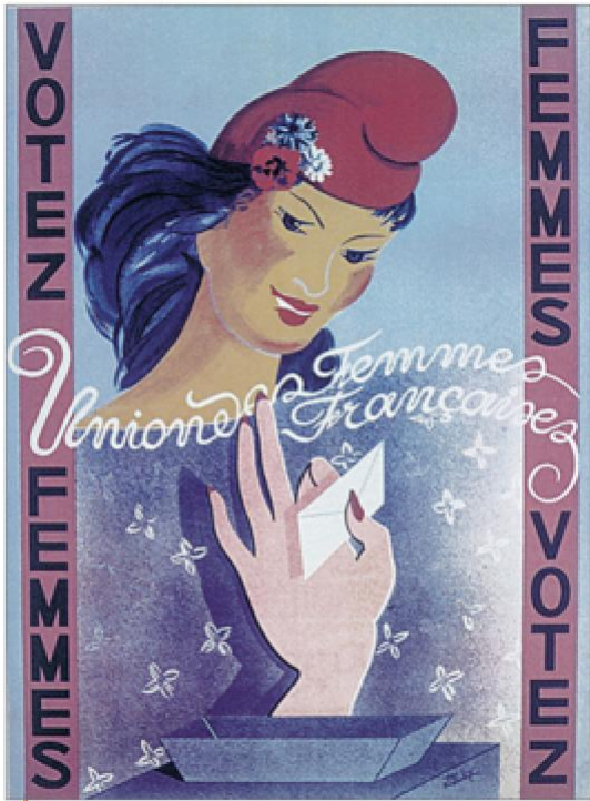
2 Les femmes appelées à voter Affiche de l'UFF (Union des femmes françaises), 1945.

Introduction : Charles de Gaulle avait fait la promesse dès 1942 de donner le droit de vote aux femmes. Le 21 avril 1944, il signe une ordonnance composée de 33 articles pour constituer une nouvelle base de la France d'après-guerre, parmi lesquels, l'article 17, instaurant le droit de vote des femmes. Les femmes obtiennent donc le droit de vote durant le gouvernement provisoire de la République française (GRPF).