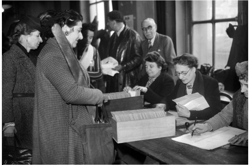
Doc. 1 Des femmes votent lors des premières élections municipales le 29 avril 1945