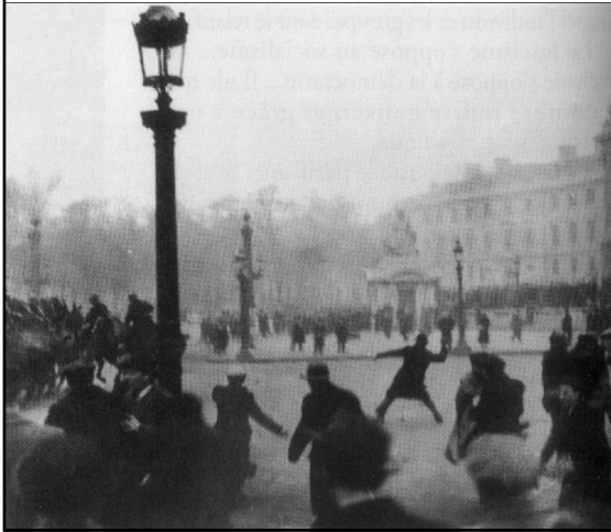
Doc. 1 Les manifestations du 6 février 1934 et du 12 février 1934