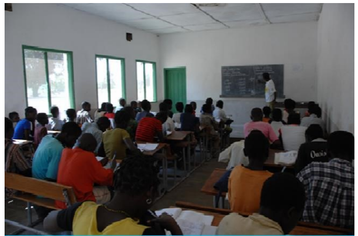
Salles de classe avant et après la campagne « Des écoles pour l’Afrique » (Mozambique)