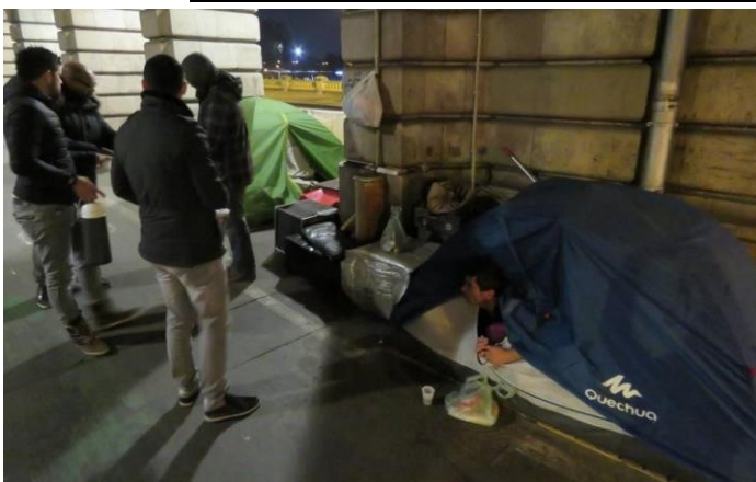
Distribution de nourriture et couvertures des quatre jeunes hommes avec les SDF à Paris

En décembre 2016, le journal Le Parisien a écrit un article pour expliquer l'action citoyenne et bénévole de quatre Parisiens qui ont distribué des repas, du café et des couvertures aux SDF à Paris, tous les jeudis durant l'hiver. Les couvertures sont récupérées dans des magasins qui ne peuvent plus les vendre, car elles sont tachées ou ont un défaut. Leurs familles et amis sont sollicités pour donner de l'argent ou cuisiner des gâteaux. Ils préparent 45 sacs repas contenant un sandwich, des chips, une bouteille d'eau, des clémentines et du gâteau. Les jeunes hommes font le tour de Paris et distribuent de la nourriture et des couvertures au fil des rencontres avec les Sans Domicile Fixe. En France, il y a environ 130 000 SDF dont la moitié vit en Île-de-France (Paris).