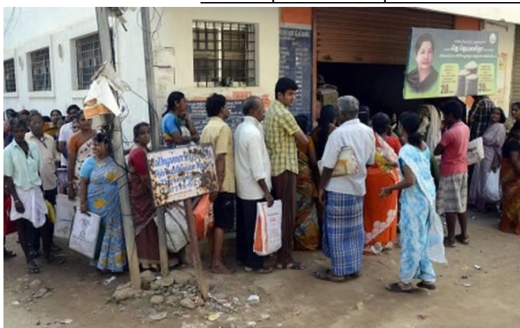
Indiens qui attendent pour recevoir une ration de céréales (Chennai).

* carte de rationnement : carte indiquant la quantité de nourriture qu'une personne peut obtenir.