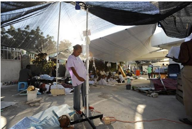
Installations de Médecins sans frontières en Haïti

*ONG : (organisation non gouvernementale) organisation qui agit dans une société ou qui a un caractère humanitaire, mais qui ne dépend pas d'un État ou d'une institution internationale.