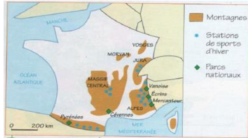
2 Un atout : le tourisme de montagne