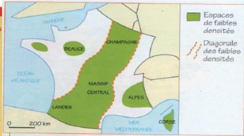
1 La France des faibles densités