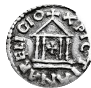
« La religion chrétienne »