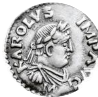
« Charles empereur auguste »